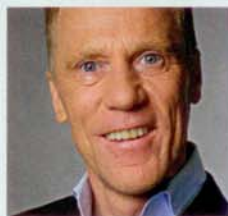
INGO FRABÖSE Medico sportivo e rettore dell'Università tedesca dello Sport di Colonia